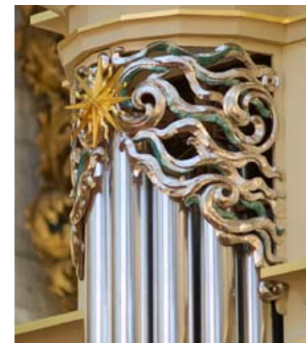
Ornamente der Chororgel