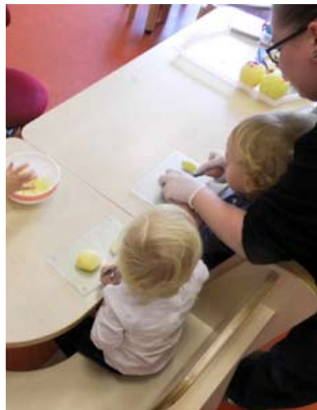
Krippenkinder schneiden Äpfel für den Apfelkuchen

In verschiedenen Kleingruppen werden regelmäßig drei bis vier Kinder mit ähnlichem Entwicklungsstand durch gezielte Angebote gefördert.