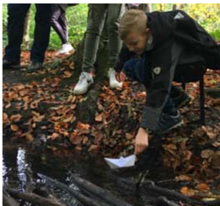
Im Wald lassen Konfis ein Dankesgebet davonschwimmen.

Mit der Actionbound-App lassen sich spannende, lustige und lehrreiche Smartphone- und Tablet-Rallyes erstellen. Diese multimedialen Erleb-