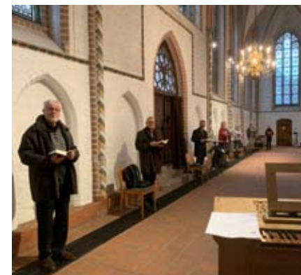
Vokalensemble in Vorbereitung auf den Gottesdienst am 1. Advent

An dieser Stelle einen großen Dank an die vielen Sängerinnen und Sänger aus den Chören, die als Helferinnen und Helfer zur Verfügung gestanden und diese Aufgabe mit viel Freude übernommen haben!