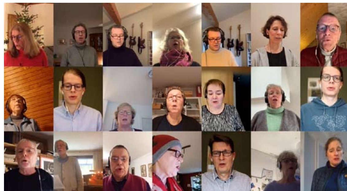
Chorgesang digital - screenshot vom Video "Wie schön leuchtet der Morgenstern"

Sobald es möglich ist, wird auch wieder Kirchenmusik in der Kirche stattfinden.