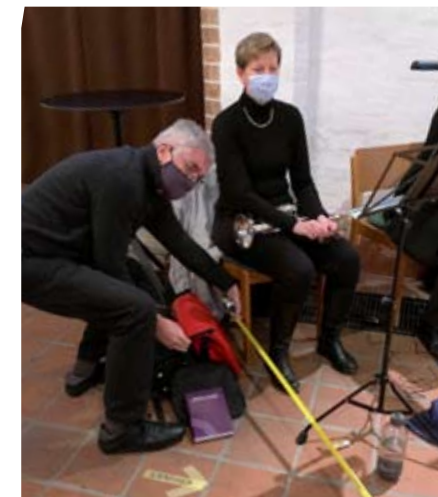
Posaunenchor bei der Vorbereitung zur musikalischen Andacht am 3. Advent – Abstände werden gemessen!

erklingen, in einigen Musiken zur Marktzeit, in Konzerten und musikalischen Gottesdiensten – immer unter strenger Einhaltung aller Hygienemaßnahmen.