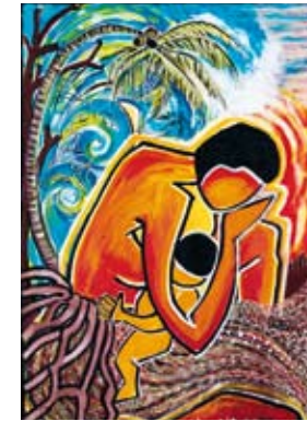
„Cyclon PAM II. 13th of March 2015“ © Juliette Pita

Vanuatu steht im Zentrum des Weltgebetstages der Frauen 2021.