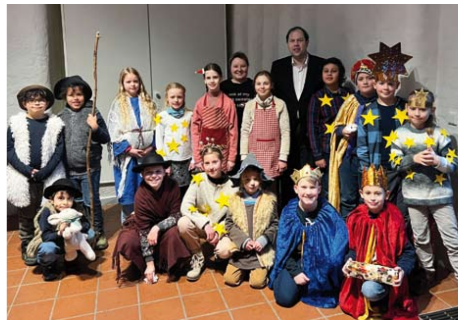
Die Aufregung vor dem Auftritt ist immer riesig.