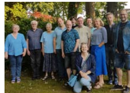
Unsere Kirchenvorsteher auf Klausur in Bad Bederkesa

Zusammen mit dem Pfarramt gibt der Kirchenvorstand seiner Kirchengemeinde ein Gesicht. Mit viel Leidenschaft und verschiedensten persönlichen Begabungen schafft er die Grundlage für ein lebendiges Gemeindeleben. Als Leitungsgremium trifft er sich monatlich zu einer gemeinsamen Sitzung.