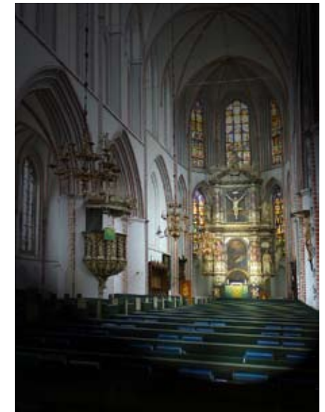
Die St.-Petri-Kirche in einem anderen Licht