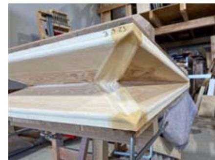
Der neue Balg unserer Chororgel