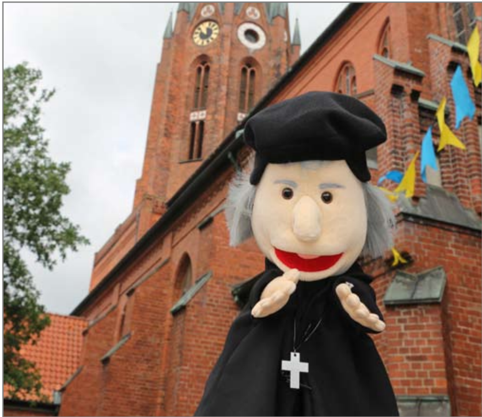
Martin Luther in St. Petri